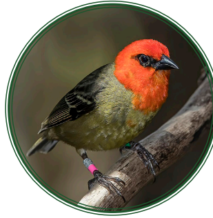
चिड़िया / पक्षी